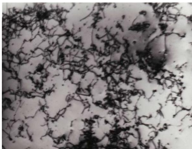
Рис. 2. Электронная микрофотография, иллюстрирующая изменение дислокационной структуры в деформированных объемах образцов из стали 20: ячеистая дислокационная структура на стадии деформационного упрочнения (x14000)

Как уже отмечалось, существует ряд механизмов, объясняющих структурные перестройки в дефектной подсистеме [1–3, 5, 12] от хаотического распределения дислокаций к более организованному с образованием ячеек и фрагментов. Наделение ансамбля (группы) дислокаций волновыми свойствами позволяет предложить механизм структурной перестройки как результат самоорганизации в дефектной подсистеме, являющейся открытой нелинейной системой. Наличие волновых свойств обеспечивает как движение ансамбля дислокаций, так и перестройку дислокационных структур при внешнем воздействии. При совпадении частот групп дислокаций резонансы вызывают хаотическое состояние (волновой хаос) в дефектной подсистеме. Иными словами, различные дислокации обладают различными длинами волн и частотами. Поэтому хаотическое состояние в дефектной подсистеме, предшествующее структурной перестройке – самоорганизации, происходит при равенстве частот колебаний ансамблей дислокаций. Вероятность этого события возрастает при \rho \approx \rho_{кр} .