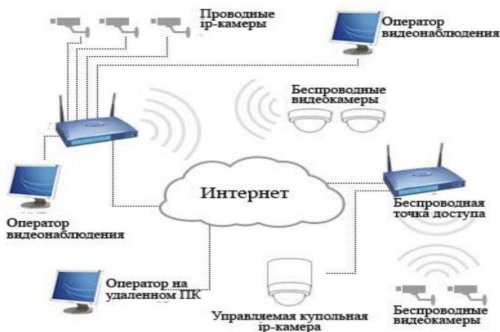
Рис. 3. Принцип работы системы IP-камер

На рис. 3 приводится принцип функционирования системы IP-камер.