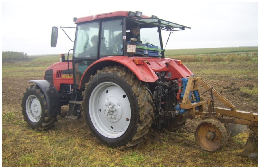
Рис. 1. Общий вид трактора «Беларус – 922» с плугом ПЛН -3-35 при испытаниях

Следующим этапом научных исследований, явилось испытание трактора «Беларус – 922» при работе в полевых условиях с применением ЭТЭ (рис. 1). Тяговые испытания проводились в соответствии с ГОСТ 7057-2001. Условия испытаний (метеорологические, характеристики поля и почвы) определялись согласно ГОСТ 20915-2011. Тяговые показатели определялись нагружением движущегося трактора силой, приложенной к тягово-сцепному устройству.