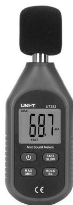
Рис. 2. Портативный шумомер UNI-T UT353

Для объективного определения уровня шума, в работе, был использован портативный цифровой шумомер UNI-T UT353 (рис. 2). Диапазон измерений 30-130 дБ, диапазон частот 31.5 Hz – 8.5 KHz. Данный прибор предназначен для быстрого и мобильного измерения уровня акустического шума в диапазоне от 30 до 130 дБ. Прибор имеет простую и надежную конструкцию и предельно простое управление. Данные об уровне шума выводятся на большой контрастный жидкокристаллический дисплей с подсветкой. Результаты измерений и расчетов шумовых характеристик при трелевке леса представлены в табл. 1.