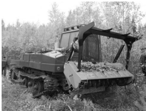
Рис. 1. Трелевочный трактор ОНЕЖЕЦ 300

Методика исследования. Исследования проводились в Ленинградской области при проведении лесозаготовительных работ на тракторе ОНЕЖЕЦ 300 (рис. 1).