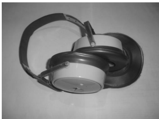
Рис. 3. Противошумные наушники ВЦНИИОТ-1

Уровень шума в расчетной точке после введения мероприятия по звукопоглощению определяется по следующей формуле: