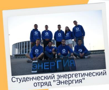
Студенческий энергетический отряд "Энергия"