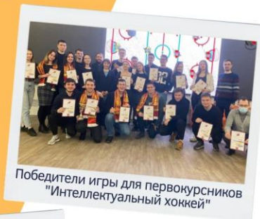
Победители игры для первокурсников "Интеллектуальный хоккей"