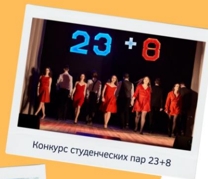
Конкурс студенческих пар 23+8