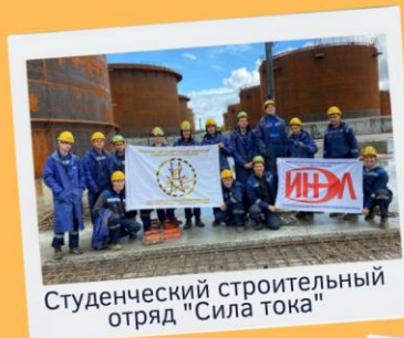
Студенческий строительный отряд "Сила тока"