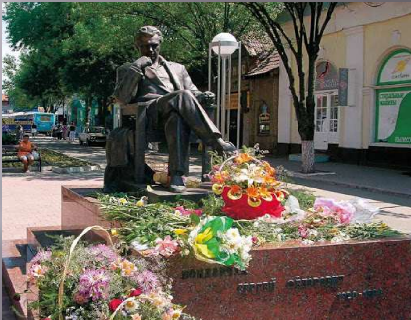
Памятник Сергею Бондарчуку в Ейске