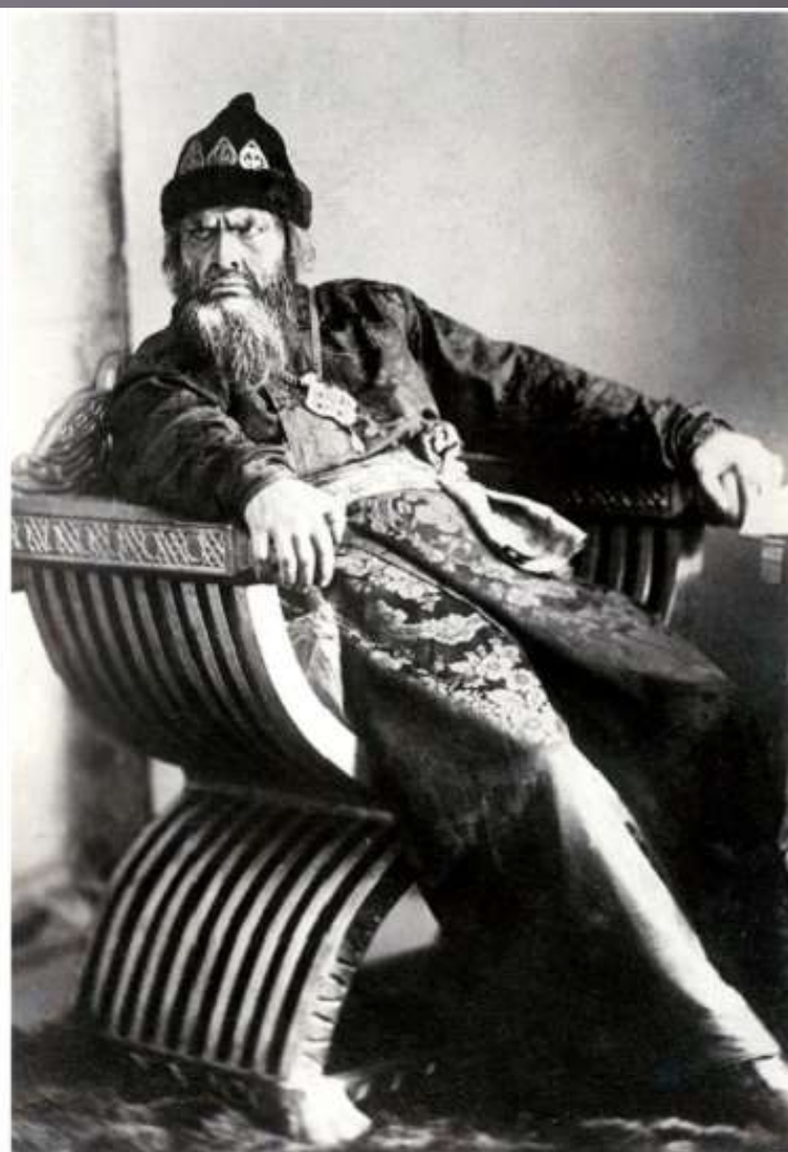
Фёдор Шаляпин в сценических образах Мефистофеля, Ивана Грозного.