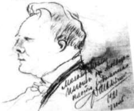
Ф. Шаляпин. Автопортрет. Рисунок. 1921