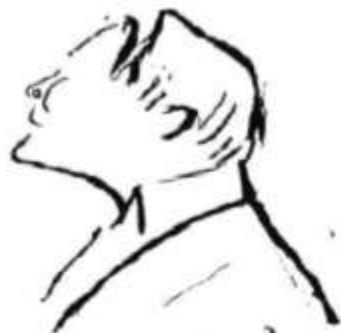
Ф. Шаляпин. Автопортрет. Рисунок. 1914