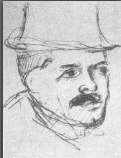
Ф. Шаляпин. Портрет С. П. Дягилева. Рисунок. 1910