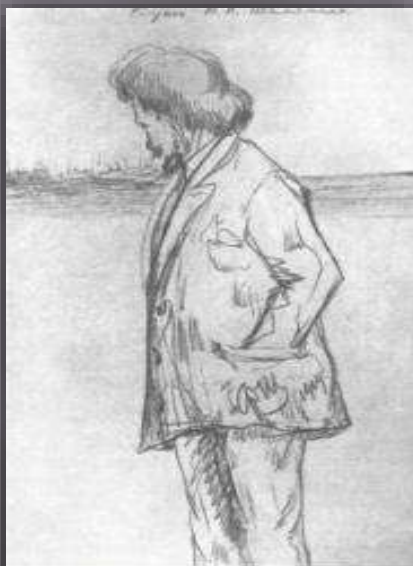
Ф. Шаляпин. Портрет И. Е. Репина. Рисунок. 1919