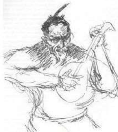
Ф. Шаляпин. Автопортрет в роли Мефистофеля. Опера Гуно «Фауст». Рисунки 1917

Зарисовки сценических образов, которых играл великий Шаляпин.