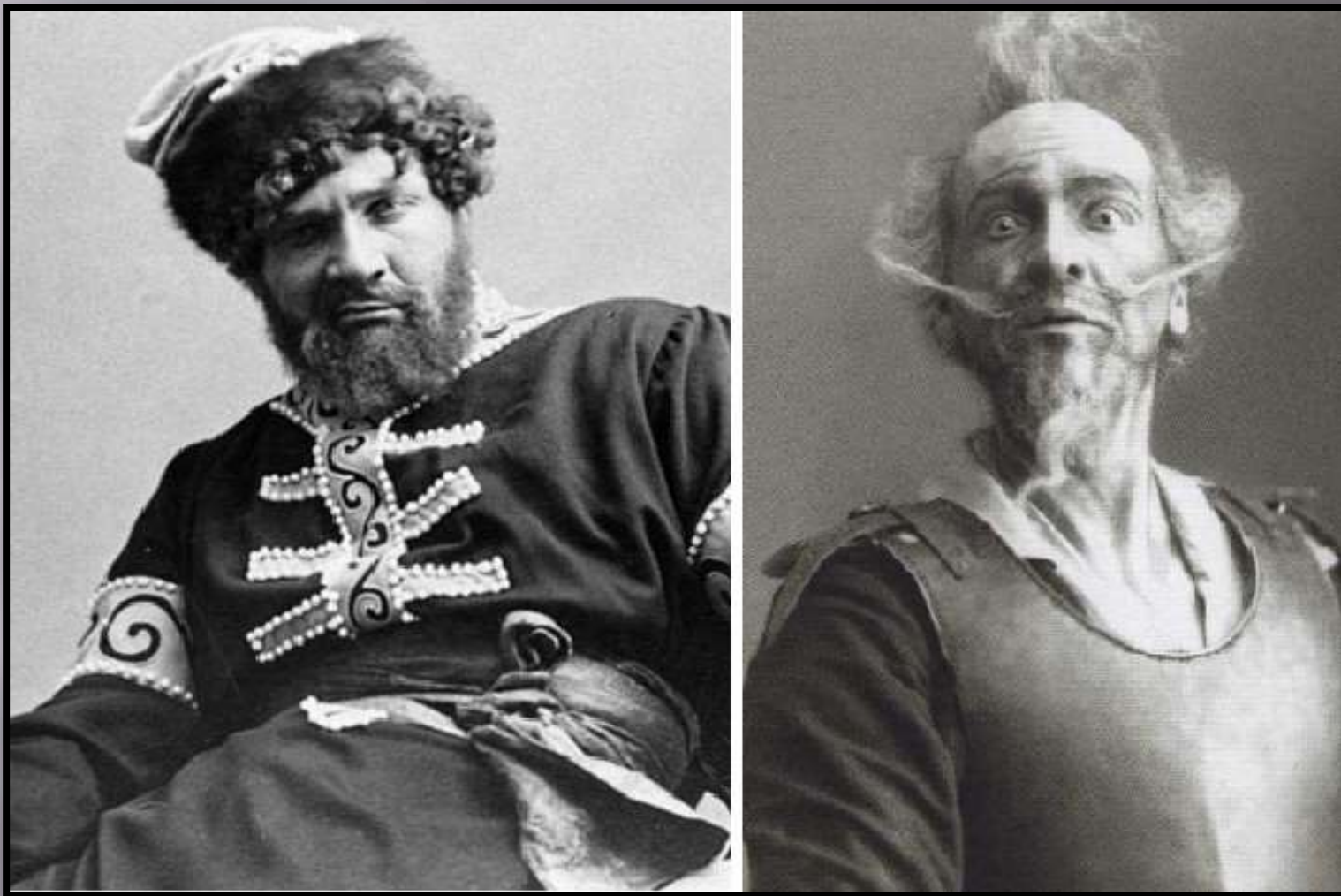
Сценические образы Фёдора Шаляпина.