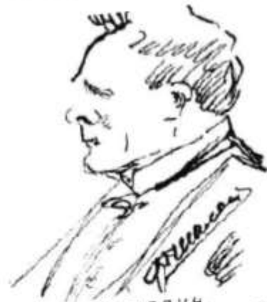
Ф. Шаляпин. Автопортрет. Рисунок. 1918