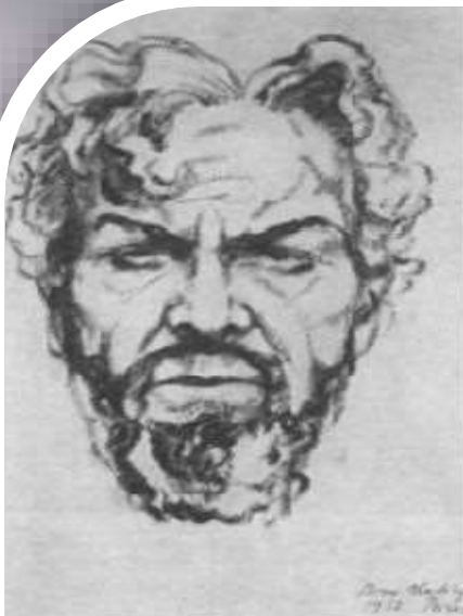
Б. Ф. Шаляпин. Ф. И. Шаляпин в роли Бориса Годунова. Рисунок. 1932