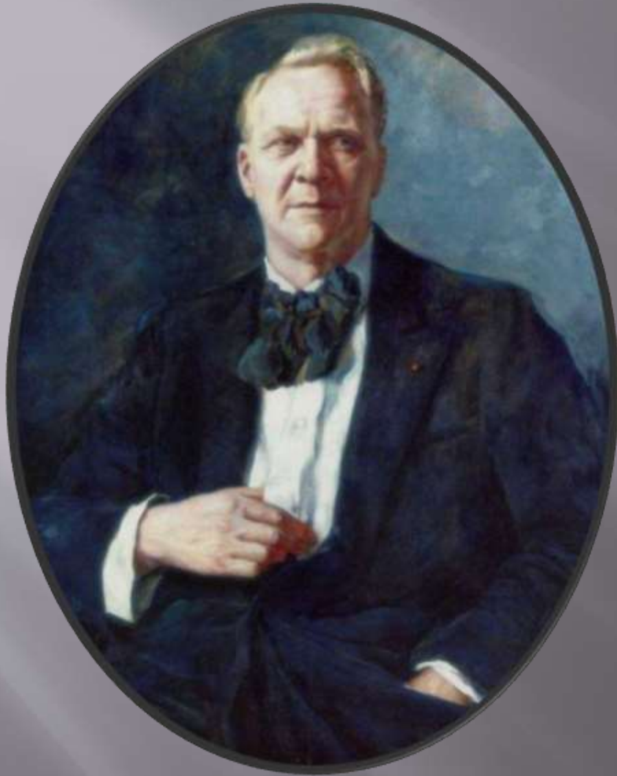
Б. Шаляпин. Портрет отца.

На протяжении всей жизни рядом с Шаляпиным шли художники. Старший сын Фёдора Ивановича – Борис стал профессиональным художником. Он рисовал отца множество раз, в разных ролях. «Отец с его способностью глубоко входить в образ давал мне прекрасную возможность выразить психологию человека», – говорил художник.