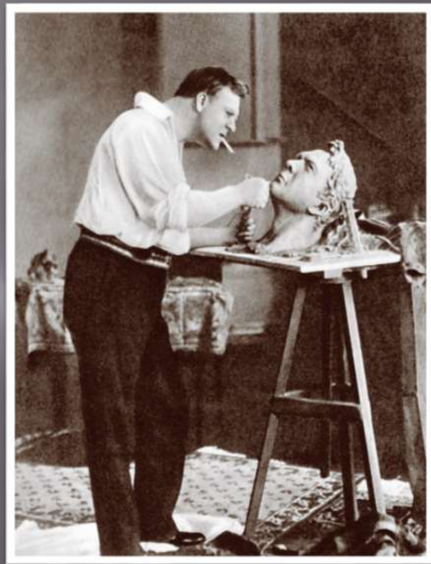
Фёдор Шаляпин в мастерской.

Но, несмотря на своё пристрастие к графическим зарисовкам, Шаляпин больше всего любил ваять из глины. И тут также больше всего ему удавались автопортреты в виде бюстов. Из воспоминаний Сергея Коненкова: «Однажды Шаляпин сказал нам, художникам, что он рождён быть скульптором». Наверняка так оно бы и было, не стань он гениальным оперным певцом и потрясающим артистом.