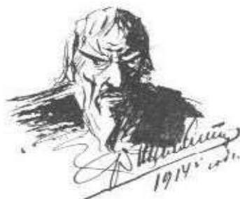
Ф. Шаляпин. Автопортрет в роли Ивана Грозного. Рисунок. 1914