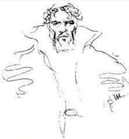
Ф. Шаляпин. Автопортрет в роли Бориса Годунова. Рисунок. 1916