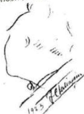
Ф. Шаляпин. Автопортрет. 1923