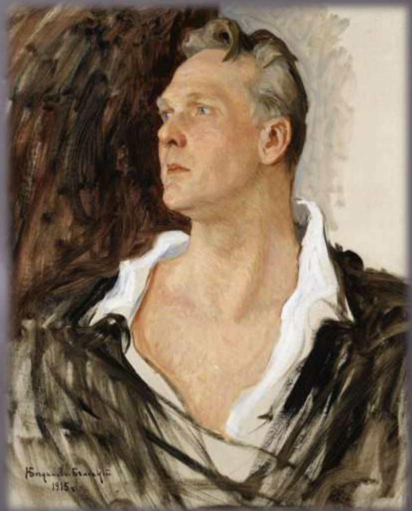
Н. Богданов-Бельский. Портрет Фёдора Шаляпина.

Таким его современники видели и запечатлевали Шаляпина и в пору расцвета, и в годы зрелости.