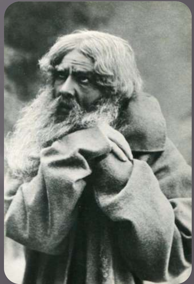
Сценические образы Фёдора Шаляпина.