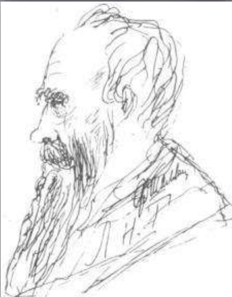
Ф. Шаляпин. Портрет Л. Н. Толстого. Рисунок. 1908