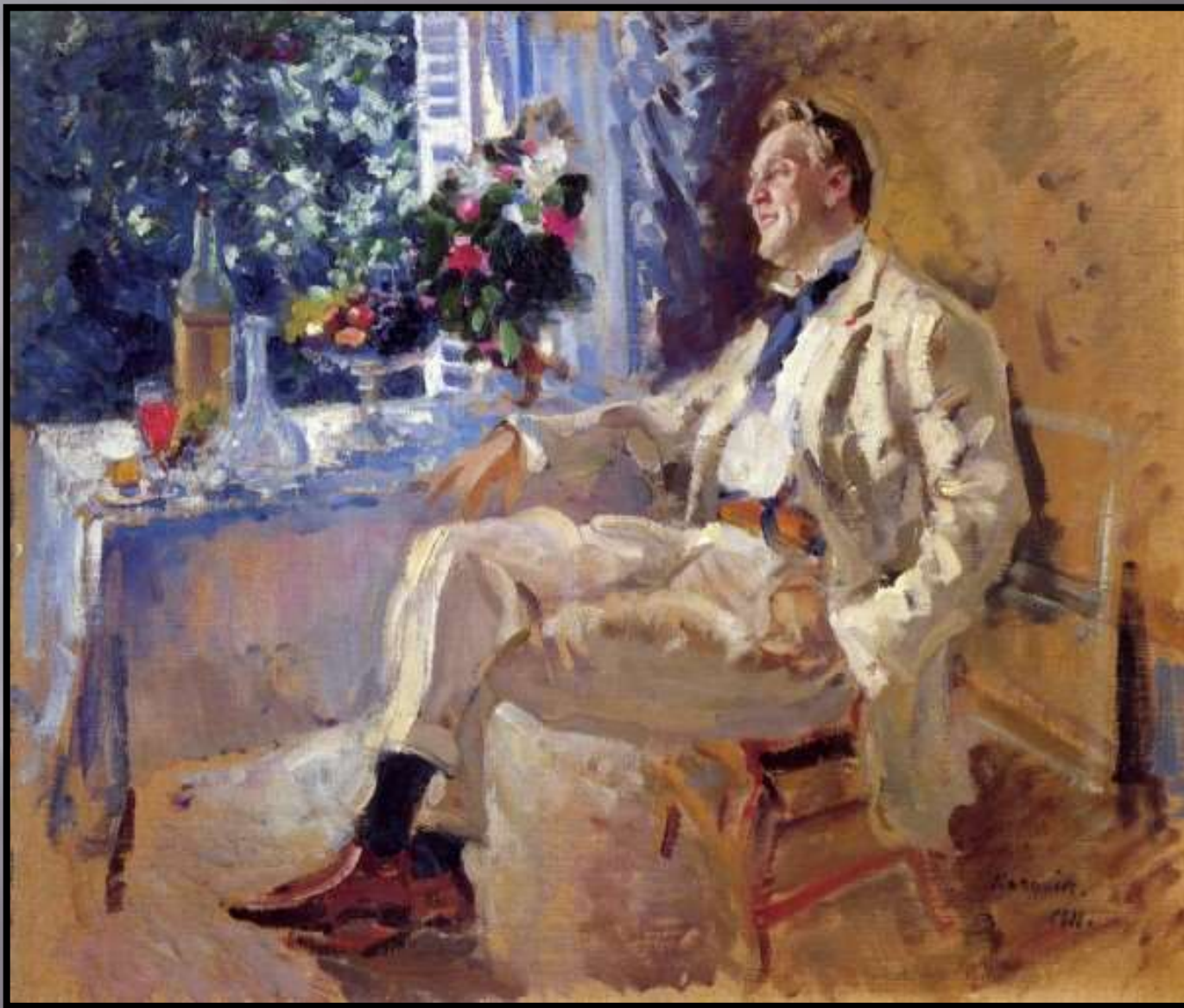
К. Коровин. Портрет артиста Ф. И. Шаляпина.