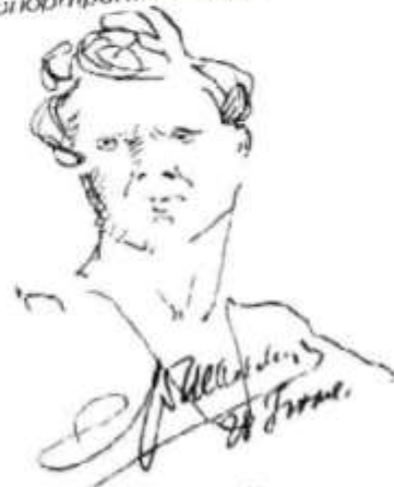
Ф. Шаляпин. Автопортрет. Рисунок.

Держа в руке карандаш или перо, Шаляпин закреплял свои мысли или слова рисунками, в этом была органическая потребность актёра.