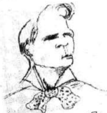
Ф. Шаляпин. «Я». Автошарж. 1916