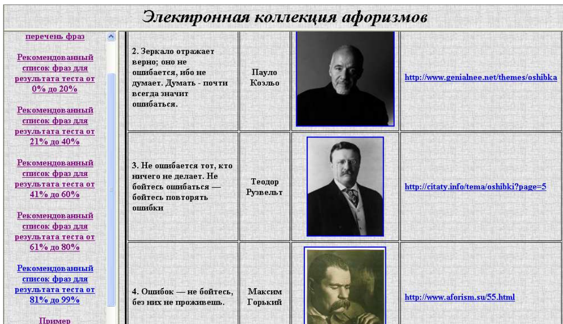
Рис. 1. Внешний вид «Электронной коллекции афоризмов»