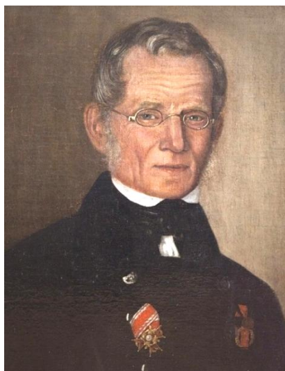
Рис. 1. Михаил Петрович Коринфский