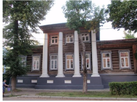
Рис. 3. Дом купца А.И. Попова

Кроме метода ассоциаций, разработчиками данного продукта был сделан акцент на визуализацию. Наиболее наглядными способами представления учебной информации в настоящее время являются веб-сайты, электронные презентации и альбомы, видеоролики. В последние годы в образовательном процессе все чаще применяются веб-ресурсы, созданные на базе интерактивных карт.