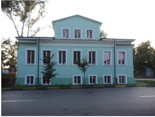
Рис. 2. Дом г-жи Анненковой