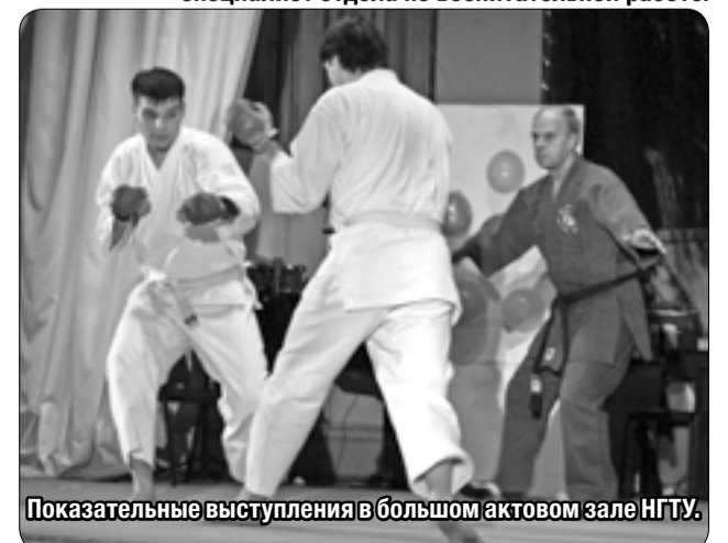
Показательные выступления в большом актовом зале НГТУ.

специалист отдела по воспитательной работе.