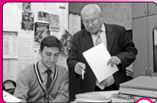
Отчетно-выборная профсоюзная конференция