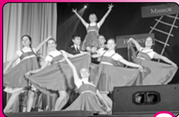
Межвузовский слет лучших групп