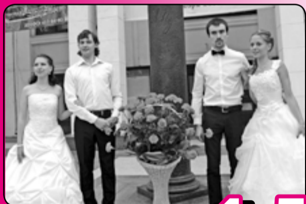
VII фестиваль «Студенческая Болдинская осень»