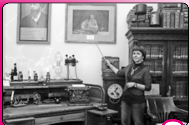
К 100-летию НГТУ