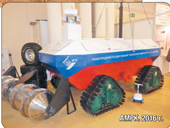
АМПК. 2016 г.

В 2004 году на базе таких научных подразделений автомобильного факультета Нижегородского политеха, как НИЛ ВМ, НИЛ РАЛСНЕМГ, НИЛ СДМ, СКТБ ТТМ, было основано структурное подразделение, которое с 2010 года называется Научно-исследовательской