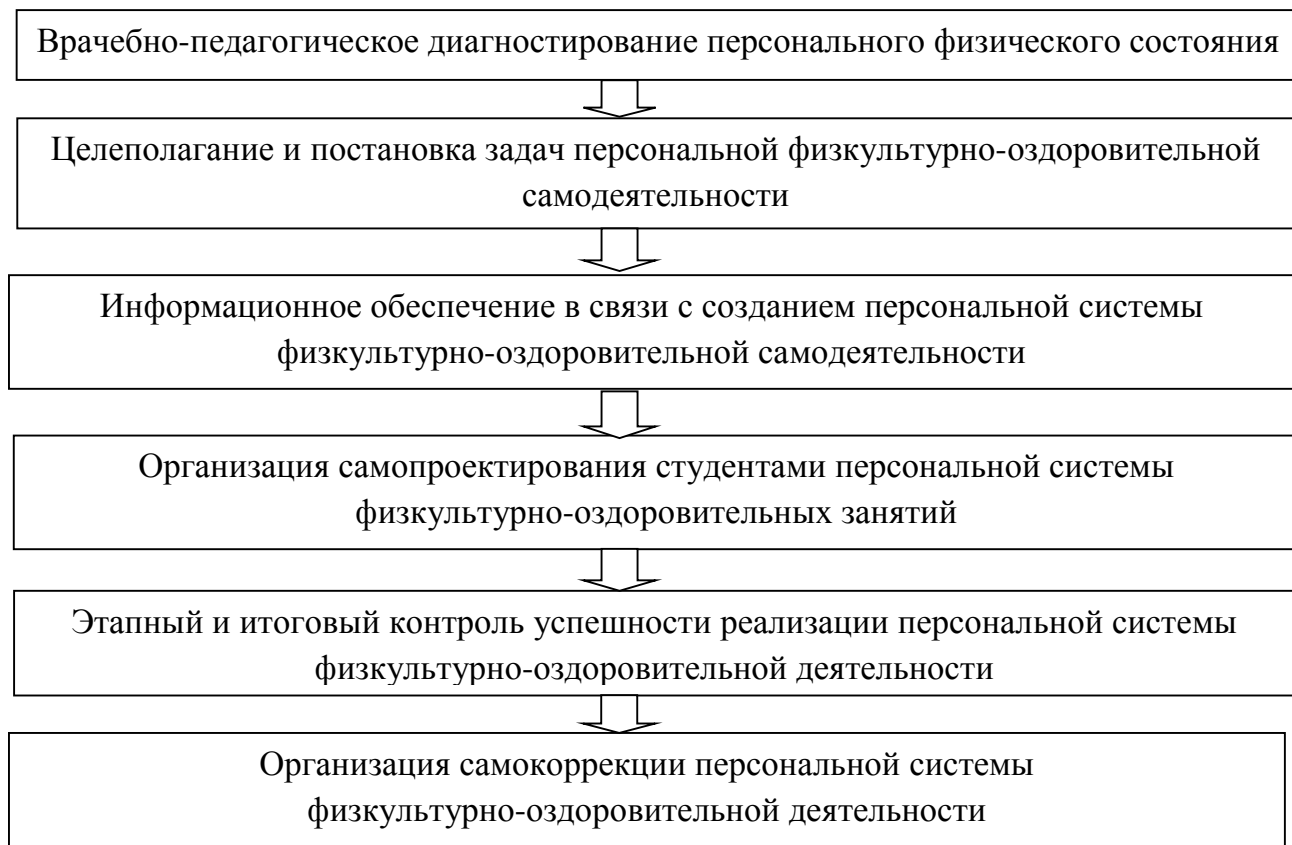
Рис. 4.1. Алгоритм организационно-содержательного обеспечения процесса формирования готовности студентов СМГ к физкультурно-оздоровительной самодеятельности

Процесс формирования готовности студентов к созданию персональной системы ФОД и обучения определяется задаваемыми алгоритмами. Разработаны алгоритмы учебной (для студентов) и обучающей (для преподавателей) деятельностей. Соответственно они представлены на рис. 4.1 и рис. 4.2. Следуя алгоритму, преподаватель может судить об эффективности применения той или иной технологии обучения, выделить факторы, влияющие на качество обучения и достигнутый результат в физкультурно-оздоровительной деятельности.