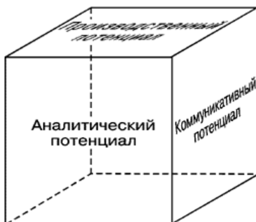
Рисунок 1 – Различные стороны потенциала маркетингового инструментария

При ссылках на рисунки при нумерации в пределах раздела следует писать: «... в соответствии с рисунком 4.3»; а при сквозной нумерации: «... в соответствии с рисунком 4».