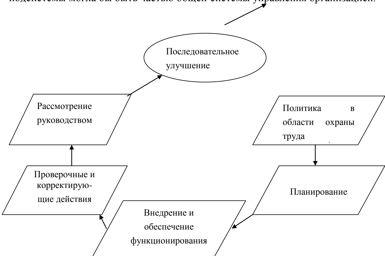
Рис.3. Модель системы управления охраной труда

Требования СУОТ к такой модели установлены ГОСТ 12.0.230-2007 «Общие требования к управлению охраной труда в организации». Эти требования соответствуют международному стандарту и ориентируются на создание системы управления охраной труда организации, которая в виде подсистемы могла бы быть частью общей системы управления организацией.