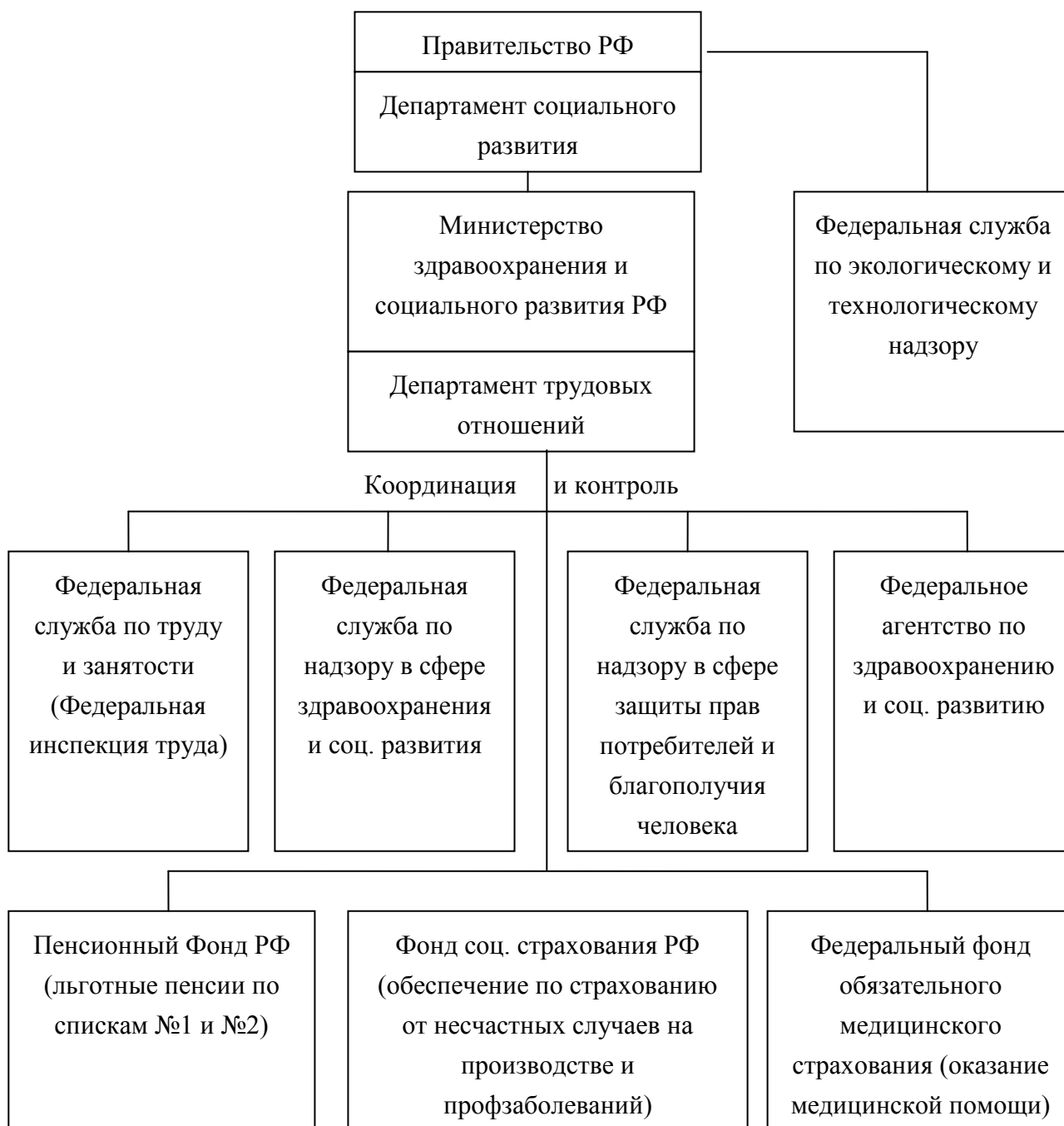
Рис. 1. Система государственного управления охраной труда

В ведении Министерства здравоохранения и социального развития РФ также находится Федеральная служба по надзору в сфере защиты прав потребителей и благополучия человека (Роспотребнадзор), которая является уполномоченным федеральным органом исполнительной власти, осуществляющим функции по контролю и надзору в сфере обеспечения санитарно-эпидемиологического благополучия населения, защиты прав потребителей и потребительского рынка. Положение о Федеральной службе по надзору в сфере защиты прав потребителей и благополучию человека