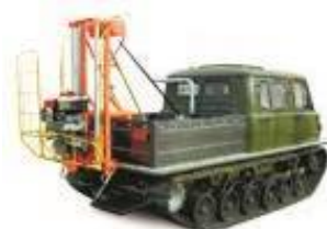
Гусеничный снегоболотоход ЗВМ-2412 «Узола»