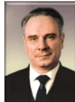
Африкантов Игорь Иванович (1916 – 1969 гг.)

Заслуженный деятель науки и техники РСФСР, лауреат Сталинской премии, заслуженный изобретатель СССР, почетный полярник СССР, доктор технических наук, профессор. Испытывал первый советский гоночный автомобиль «ГЛ-1», на котором установил всесоюзный рекорд скорости – 161,87 км/ч (1938 г.).