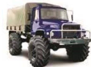
Колесный снегоболотоход ЗВМ-39081 «Сивер»