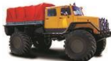
Колесный снегоболотоход ЗВМ-39082 «Сивер» «Унжа»