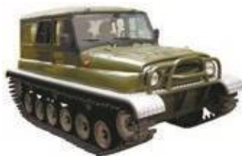
Гусеничный снегоболотоход ЗВМ-2410 «Ухтыш»