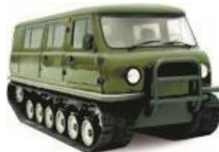
Гусеничный снегоболотоход ЗВМ-2411 «Узола»