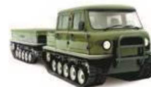
Двухзвенный гусеничный снегоболотоход ЗВМ-3401