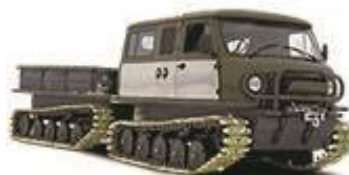
Двухзвенный гусеничный снегоболотоход ЗВМ-3402 «Унжа»