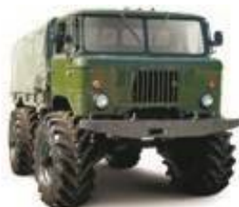
Колесный снегоболотоход ЗВМ-3966 «Сивер»