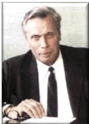
Алексеев Ростислав Евгеньевич (1916 – 1980 гг.)

Создатель судов на подводных крыльях, доктор технических наук, лауреат Ленинской и Государственных премий, выпускник кораблестроительного факультета (1941 г.). В 2007 году имя Р.Е. Алексеева присвоено Нижегородскому государственному техническому университету.