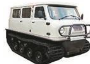
Короткобазный гусеничный снегоболотоход ЗВМ-24112П «Узола»