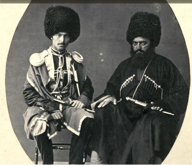
Мужчины на русской службе, 1866 г.

Черкесы* (адыги с языком черкесским, адыгэ с языком черкесским, бесленеевцы, убыхи, адыги-черкесы с языком черкесским, сирийские адыги)