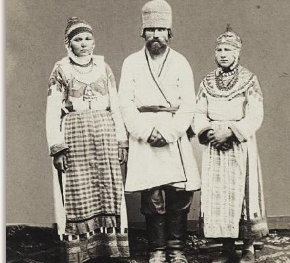
Группа чувашей в национальных костюмах, 1868-1869 гг. Чуваши. Татарстан, г.Казань Кунсткамера. Музейный номер МАЭ № 106А-74