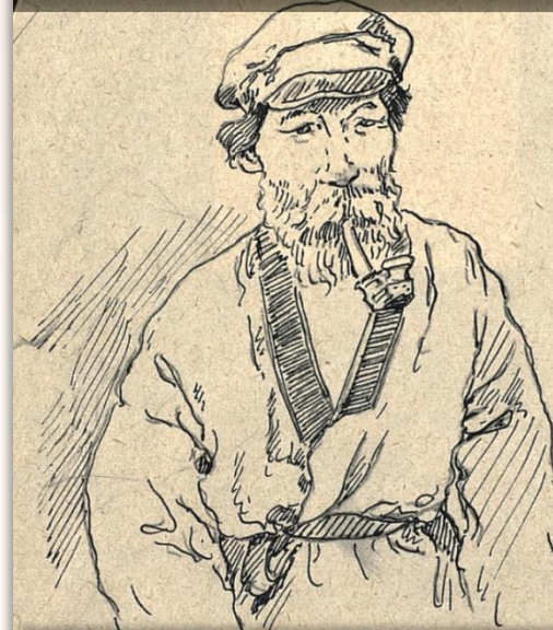
Портрет мужчины, 1930 г. Художник – Г.И.Гуркин (Чорос-Гуркин) Челканцы. Алтай респ. Кунсткамера. Музейный номер МАЭ И 122-50