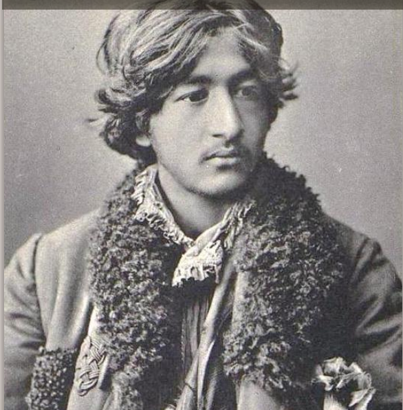
Типы цыгань : (открытое письмо), кон. XIX – нач. XX вв. Собств. изд. фот. М. Дмитриева, Н.Новгородъ ГИМ. Номер ГИМ 96851/977. Номер ГК 28665864 Отдел/коллекция – ИЗО/Фотография

Цыгане (среднеазиатские) — численность в РФ 12 чел.**