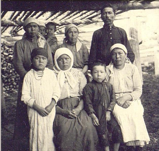
Портрет семьи, 1927 г. Шорцы. Кемеровская обл. Горно-Шорский (исторический) национальный р-н Кунсткамера. Музейный номер МАЭ № 3662-66