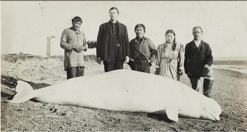
Бълука (родъ дельфинов), 1897 - 1907 Чукчи. Чукотский АО, Анадырский край, с.Марково (Анадырский уезд Приморской обл.) Кунсткамера. Музейный номер МАЭ И 502-14