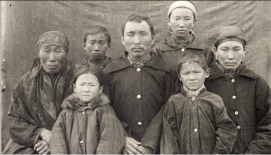
Группа якутов из семи человек, кон. XIX в. Якутия (Саха) Кунсткамера. Музейный номер МАЭ № 4399-187