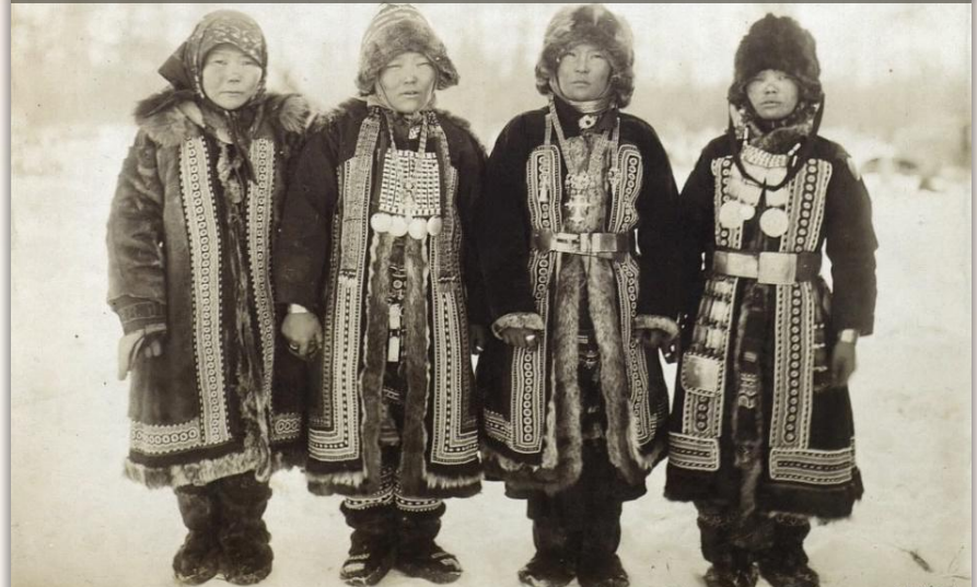
Групповой портрет женщин в традиционных костюмах, кон. XIX в. Фотограф – Э.К.Пекарский Эвены. Якутия (Саха) Кусткамера. Музейный номер МАЭ № 971-3