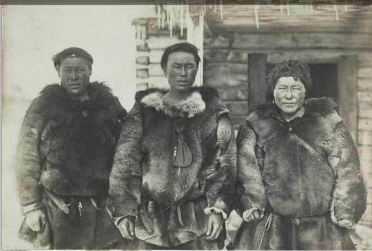
Кочующие чуванцы. Анадырский уезд, 1897-1907 гг.