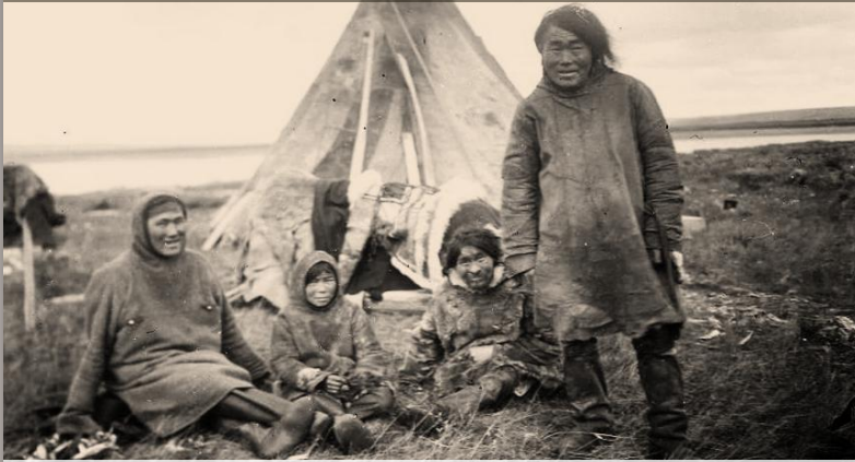
Семья у чума, 1936-1937 гг. Энцы. Таймырский (Долгано-Ненецкий) АО, Усть-Енисейский р-н, пос.Гольчиха