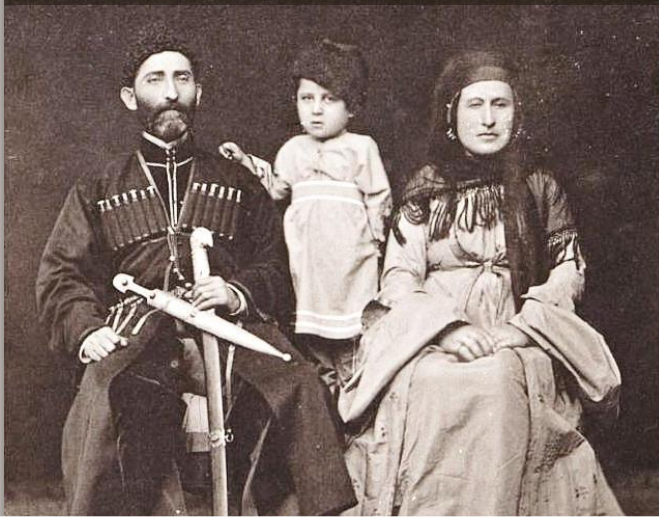
Чеченцы, кон. XIX в., Российская империя Фотограф – Д.И.Ермаков ГИМ. Инвентарный номер И IX 6371 Номер ГИМ 96851/818. Номер ГК 28668440

Чеченцы-аккинцы* (акинцы, аккинцы, ауховцы, чеченцы-акинцы) — численность в РФ 54 чел.**