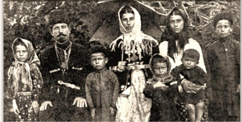
Шапсугская семья из долины реки Аше, 1916 г.