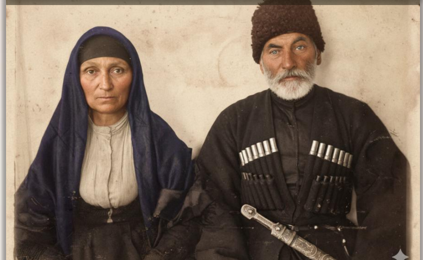
Семейная пара черкесогаев. Армавир, Краснодарский край, сер. XX в.