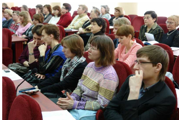
Рис. 5. Научно-практический семинар ГПНТБ, Нижний Новгород 14 марта 2012 г.

Усиление роли библиотеки как основного поставщика информационных ресурсов для студентов, преподавателей и сотрудников университета, дальнейшее развитие электронной библиотеки и расширение спектра информационных ресурсов по направлениям научно-образовательной деятельности университета позволят НТБ и в будущем быть активным участником единого информационно-образовательного пространства вуза.