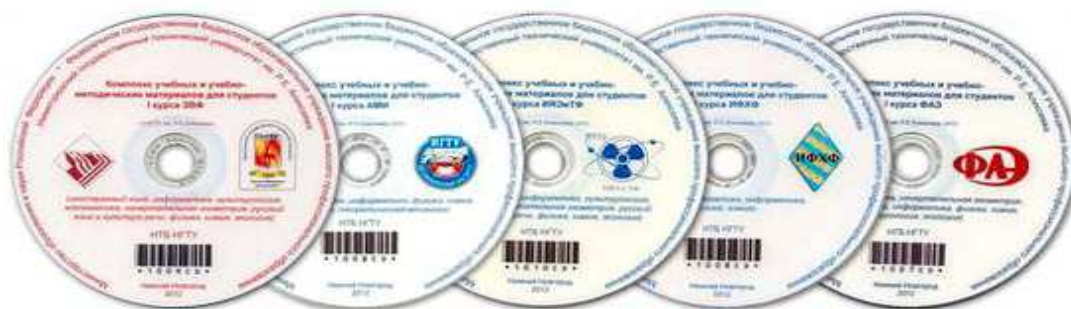
Рис. 1. Комплекс учебных и учебно-методических материалов для студентов первых курсов ЗВФ, ИФХФ, ИЯЭиТФ, АМИ, ФАЭ

Формирование информационной культуры пользователей по-прежнему остается важным направлением работы НТБ. Оно включает организацию занятий со студентами, аспирантами; совершенствование дистанционного