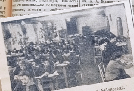
Вечером в читальном зале нашей библиотеки.

На пополнение фонда библиотек 1949 год отпущено 80 тысяч руб.