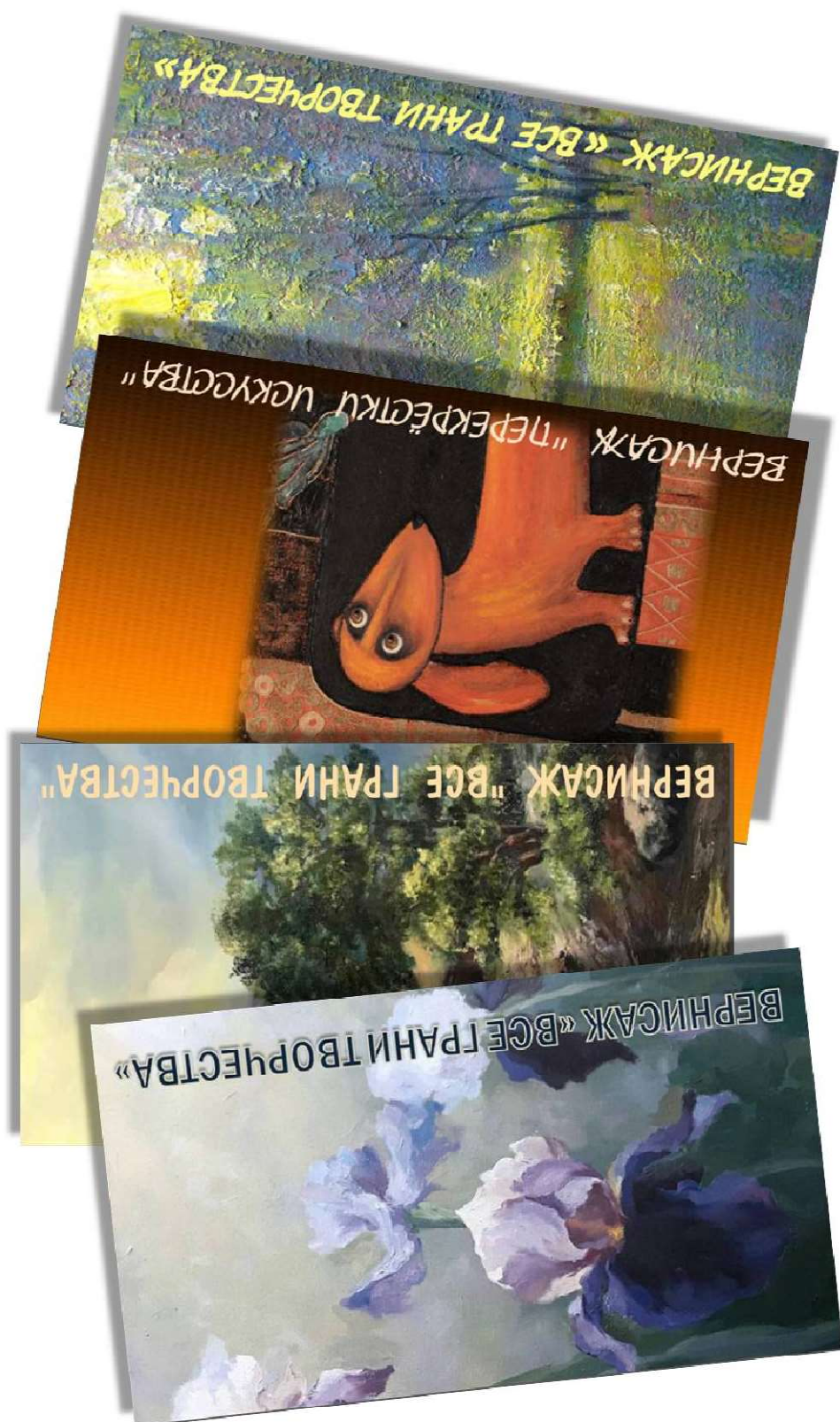
Каталоги выставок «Все грани творчества». 2017-2022 гг.