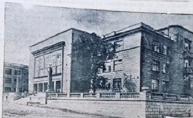
Главное здание Горьковского индустриального института им.

одной стране мира повторы —ученые, инженеры, изобретатели —не пользуются таким ем, почетом и любовью