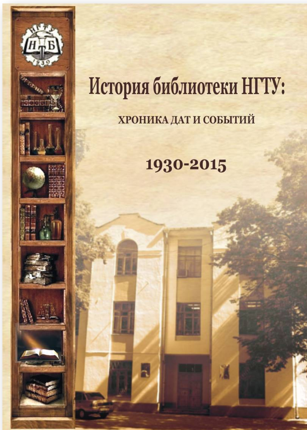
История библиотеки НГТУ: хроника дат и событий (1930-2015) : юбилейное издание