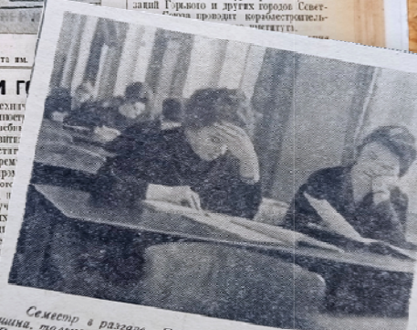
Семестр в разгаре. Переполнены читальные залы. Ты шина, только слышно, как шелестят страницы учебников. Вот и эти девушки углублены в занятия.

Подготовку кадров кораблестроители нашей организации для заводов, предприятий и конструкторских организаций Горького и других городов Советского Союза проводит кораблестроительный институт.