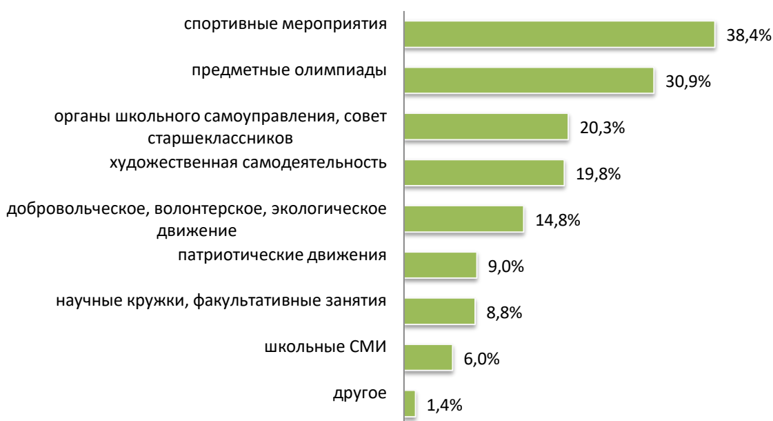
Диаграмма 2. Деятельность, в которой участвовали первокурсники до поступления в вуз

Однако 271 (31,7%) первокурсник ответил, что за время обучения в школе не принимал участие во внеучебной и научной активности.