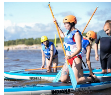
Водные виды спорта