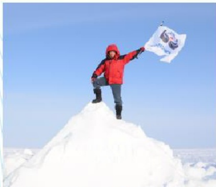
Председатель совета директоров ТЭЦ водрузил флаг предприятия на Северном полюсе

Туристические походы и путешествия с участием сотрудников ТЭЦ проходили по следующим маршрутам России: вулканы и долина гейзеров Камчатки, реки Карелии (реки Охта, Кереть, Уксуниек), каскад водопадов на реке Шинок Алтайского края, плато Маньпупунер в Республике Коми и перевал Дятлова, река Уфа и Кункурская пещера, заповедник «Столбы» Красноярского края, озеро Байкал и сплав по реке Турка в Бурятии, Кольский полуостров и многие другие.