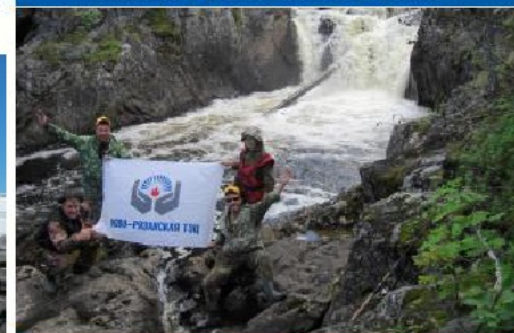
На Кольском полуострове