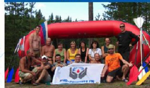
Сплав по реке Охте в Карелии