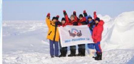
Рязанская экспедиция на Северном полюсе с флагом ТЭЦ